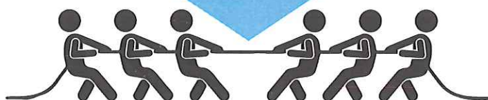
TIRO ALLA FUNE