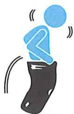
KORSA NEI SACCHI