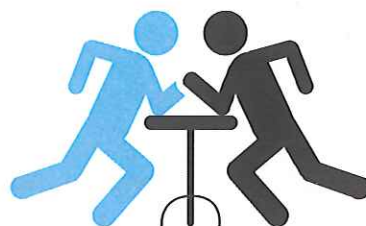
BRACCIO DI FERRO